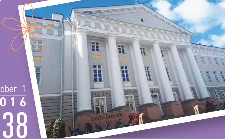
青空に映えるタルトゥ大学本部の建物