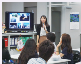
平成 28 年度第 1 回留学フェアの様子

フェア期間中はお昼休みと 3 限の時間を利用して、留学経験者による留学報告会や個別相談、本学協定校からの留学生による協定校紹介、様々な言語で話す「チャットルーム」など、日替わりのプログラムを用意しています。留学に興味のある皆さんが自由に参加できる催しとなっていますのでお気軽に、多くの皆さんのお越しをお待ちしています。