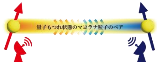
図 1. 量子テレポーテーション現象の模式図。物質中のマヨラナ粒子(黄色丸)は量子もつれ状態を形成し、電子スピン(2つの太い矢印)の量子テレポーテーション現象をもたらす。

大阪大学大学院基礎工学研究科の大学院生 高橋雅大さん、水島健准教授、藤本聡教授、東京大学大学院理学系研究科の山田昌彦特任講師、学習院大学理学部物理学科の宇田川将文教授からなる研究チームが、特殊な磁性体中に存在するマヨラナ粒子 *1 の量子もつれ *2 を利用した、量子テレポーテーション現象 *3 (図 1)を理論的に解明しました。